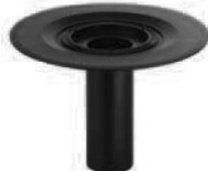
Cazoleta sumidero 84 FPO

DN Nº Ref. DN 50 837127 DN 70 837141 DN 100 837165