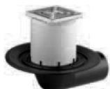
Sumidero 83 E

para montar en forjados que requieran impermeabilización