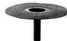
Cazoleta sumidero 84 DallBit

DN Nº Ref. DN 50 832122 DN 70 832146 DN 100 832160