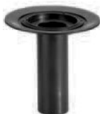
Cazoleta sumidero 84

DN Nº Ref. DN 50 831026 DN 70 831040 DN 100 831064