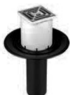
Sumidero 84 E